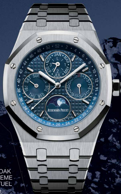
ROYAL OAK QUANTIÈME PERPETUEL EN ACIER.

LA VALLÉE DE JOUX. DEPUIS DES MILLÉNAIRES, UN ENVIRONNEMENT DUR ET SANS CONCESSION; DEPUIS 1875, LE BERCEAU D'AUDEMARS PIGUET, ÉTABLI AU VILLAGE DU BRASSUS. C'EST CETTE NATURE QUI FORGEA LES PREMIERS HORLOGERS ET C'EST SOUS SON EMPRISE QU'ILS INVENTÈRENT NOMBRE DE MÉCANISMES COMPLEXES CAPABLES D'EN DÉCODER LES MYSTÈRES. UN ESPRIT DE PIONNIERS QUI ENCORE AUJOURD'HUI NOUS INSPIRE POUR DÉFIER LES CONVENTIONS DE LA HAUTE HORLOGERIE.